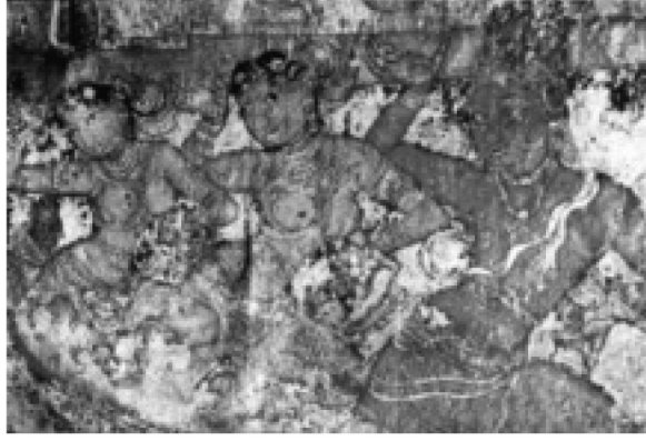
படம் 10.10 நடனமாடும் பெண்டிர் பிரகதீஸ்வரர் கோவில் கி.பி 1100

கி.பி 1336 ஆண்டு வரையிலான தமிழக வரலாறும் பண்பாடும்