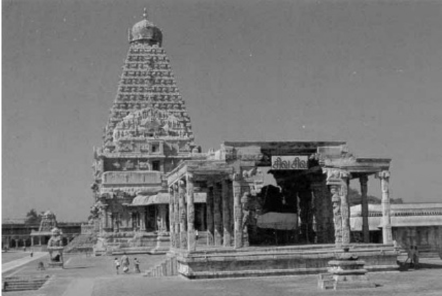
படம் 10.3. பிரகதீஸ்வரர் கோவில் தஞ்சாவூர்

இக்கோவில் மராட்டியர்களாலும் நாயக்கர்களாலும் போற்றப் பட்டு மேலும் கட்டுமானங்கள் செய்யப் பட்டன. முதலில் பெருவுடையார் கோவில் என்றழைக்கப்பட்ட இந்தக் கோவில் பின்னர் பிரகதீஸ்வரர் கோவில் என்ற பெயரை அடைந்தது.