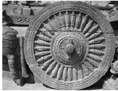
படம் 10.5 தேர்ச் சக்கரம் தாரகரம் கோவில் கி.பி 1200

பிரதான மண்டபம் ராஜ கம்பீரம் எனப்படுகிறது.இந்த இரதத்தைக் கட்டி இழுப்பது யானையாகும். மேற்கூரையை அலங்கரிக்கும் வண்ண ஓவியத்தில் இடம் பெற்றிருப்பது மலர்ந்த தாமரைக்குள் காணும் வகையில் சிவ பார்வதியின் சித்திரங்கள். மற்றொரு சித்திரத்தில் இடம் பெற்றிருப்பது ஒரு கிராமத்தில் நடக்கும் பிரசவம் அதில் உதவும் மற்ற கிராமியப் பெண்கள் என்ற காட்சி. இதன் மூலம் நமக்கு அந் நாட்டின் பழக்க வழக்கங்களைப் பற்றி அறிந்து கொள்ள இயலுகிறது.கைலாச மலையைச் சுமந்து செல்லும் இராவணன் சித்தரிக்கப்பட்ட சிற்பங்கள் வேலைப்பாட்டிற்கு ஒரு எடுத்துக்காட்டு. வீணை இல்லா சரசுவதி புத்தர் பிக்ஷாடனர் அர்த்தனாரீஸ்வரர் பிரம்மா மற்றும் சூரியன் இச் சிற்பங்களும் அலங்கரிக்கின்றன. தாரகரம் அதிக அளவில் கற்றூண்களைக் கொண்டது. இவற்றில் செதுக்கப் பட்டிருக்கும் சிற்பங்களும் சித்திரங்களும் எண்ணிலடங்கா.