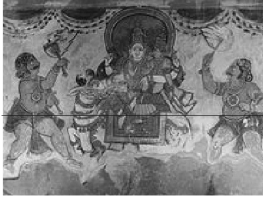
படம் 10.11 இன்னொரு சித்திரம் தஞ்சை பிரகதீஸ்வரர் கோவில் பிரகாரத்தில் உள்ளது