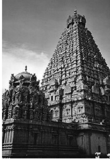
படம் 10.2 தஞ்சைப் பெரிய கோவில் கோபுரம் காண்க. தஞ்சைப் பெரிய கோவில் பெரியதும் உயரமானதும் ஆகும்.

இக்கோவிலில் இரண்டு கோபுரங்கள் ஒரே திசையில் அமைக்கப் பட்டுள்ளன. விமானம் 190அடி உயரமுள்ளது. இவை கல்வெட்டின் குறிப்புக்களில் இராஜராஜன் திருவாசல் என்றும் கேரளாந்தகன் திருவாசல் என்றும் அழைக்கப் பட்டுள்ளன. இக் கோவில் கட்ட 6 வருடங்கள் ஆயின என்ற குறிப்பும் உள்ளது.