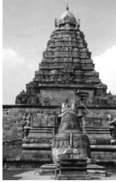
படம் 10.4 கங்கை கொண்ட சோழபுரம் கி.பி1030

இதன் சிறப்பு என்னவென்றால் இக் கோவில் கருங்கற்களைக் கொண்டுதான் கட்டப் பட்டது ஆனால் இக் கோவிலைச் சுற்றுவட்டாரத்தில் எங்கும் கருங்கற்களின் செல்வங்கள் கிடைப்பதாகத் தெரியவில்லை.