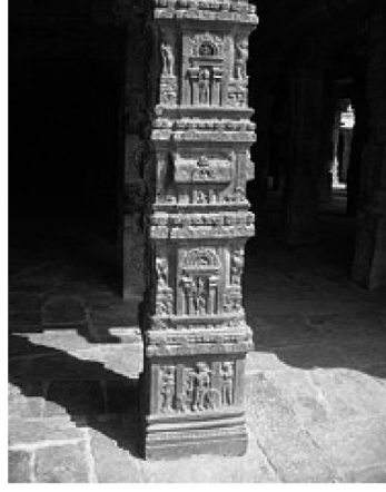
படம் 10.6 ஐராவதேஸ்வரர் கோவில் தாராசுரம்- வேலைப்பாடுடைய தூண்

முன்றாம் குலோத்துங்க சோழன் கட்டுவித்த கோவில் கம்பஹரிஸ்வர கோவில். இது திருபுவனத்தில் அமைந்துள்ளது. தாராசுரம் கங்கைகொண்ட சோழ புரம் மற்றும் தஞ்சாவூர் கோவில் கட்டுமானக் கலை நுட்பத்திற்கு இணையானது. வெண்கலச் சிலைகள்: சோழர்காலத்தின் உலோகச் சிலைகள் சிறந்த வேலைப்பாடுள்ளவையாகக் கருதப் படுகின்றன. 11ஆம் 12ஆம் நூற்றாண்டுகளில் சிற்பிகளுக்குக் கிடைத்த சுதந்திரமும் கலை நயத்திற்கான ஆதரிப்பும் இந்த சிற்பங்களையும் சிலைகளையும் பார்க்கையில் தெரிகின்றது.