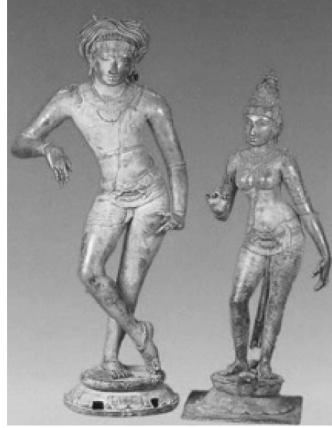
படம் 10.7 சிவ பார்வதி சிலை வெண்கலச் சிலை கி.பி.1200

முன்றாம் குலோத்துங்க சோழன் கட்டுவித்த கோவில் கம்பஹரிஸ்வர கோவில். இது திருபுவனத்தில் அமைந்துள்ளது. தாராசுரம் கங்கைகொண்ட சோழ புரம் மற்றும் தஞ்சாவூர் கோவில் கட்டுமானக் கலை நுட்பத்திற்கு இணையானது. வெண்கலச் சிலைகள்: சோழர்காலத்தின் உலோகச் சிலைகள் சிறந்த வேலைப்பாடுள்ளவையாகக் கருதப் படுகின்றன. 11ஆம் 12ஆம் நூற்றாண்டுகளில் சிற்பிகளுக்குக் கிடைத்த சுதந்திரமும் கலை நயத்திற்கான ஆதரிப்பும் இந்த சிற்பங்களையும் சிலைகளையும் பார்க்கையில் தெரிகின்றது.