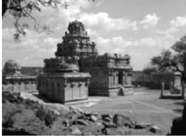
படம் 10.1 விஜயாலய சோழேச்சரம் கோவில்